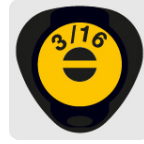
Marcado y código de color para fácil identificación de medida y punta