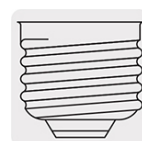
Base E26 / E27