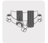
Almacenamiento de accesorios incorporado