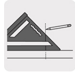
Guía para Trazado de perpendiculares