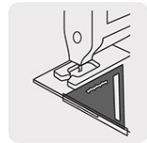
Uso como guía de corte