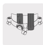
Almacenamiento de accesorios incorporado