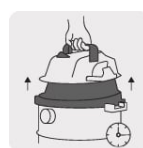
Asa de liberación rápida que facilita el vaciado