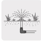
Para sistemas de riego y jardín

*La foto del producto no necesariamente corresponde a la medida del producto