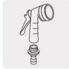
Pistolas para riego