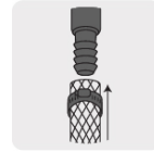
Para manguera rígida