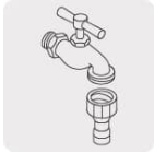
Laves de jardín