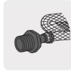
Para manguera flexible