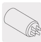
Capacitor para mayor potencia al arranque