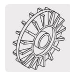
Impulsor de nylon