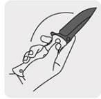
Apertura a una mano