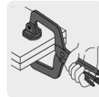
Tipo de sujeción