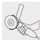
Mayor ergonomía y confort