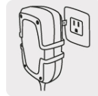
Conexión directa a corriente eléctrica