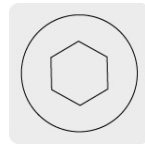
Entrada para llave allen