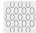
Malla al reverso