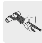
Tipo de sujeción