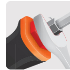
Hexágono en la barra maximiza el torque con llave