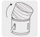
Ranura amplia para remover material fácilmente