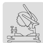
Para sierra de inglete